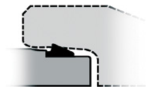
Tipo Ring-GS ancorata , sul maschio, sezione a cuneo per giunto tornito tipo "CNZ" o a strisciamento